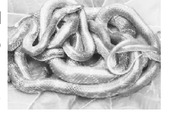
பாம்பு மலத்திலிருந்து கிருமி தயாரிக்கப்பட்டது

படத்தில் காண்பதுதான் கொரோனா வைரஸ் என்ற மிக பயங்கர கிருமியாகும். இந்த கிருமி பாம்பு மலத்திலிருந்து (கழிவு) தயாராக்கப்பட்டது. கண்களுக்கு தெரியாது இந்த கிருமி. அதனால்தான் கண்களுக்கு தெரியாத மரண எதிரி என்று இதை வர்ணிக்கிறார்கள். அதற்கென்று குறிப்பிட்ட கருவி மூலமாகத்தான் அந்த கிருமி நம் இரத்தத்தில் உண்டா என்று அறிய முடியும். அந்த குறிப்பிட்ட கருவி இந்தியாவில் எல்லா மாவட்டத்திலும் இல்லாமல் இருந்தது. இப்போது அது எல்லா ஆஸ்பத்திரிகளிலும் கிடைக்க ஏற்பாடு செய்து விட்டார்கள்.