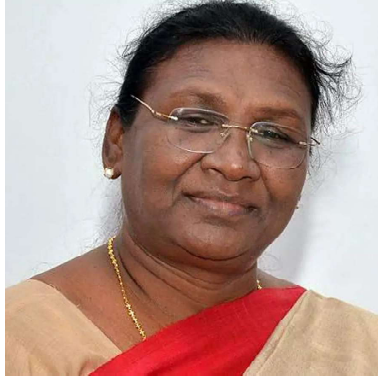
இந்திய ஜனாதிபதி திருமதி திரௌபதி முர்மு

முர்மு என்பவரை ஆளும் கட்சியினரால் பூர்ண மெஜாரிட்டியுடன் தெரிந் தெடுக்கப்பட்டார்.