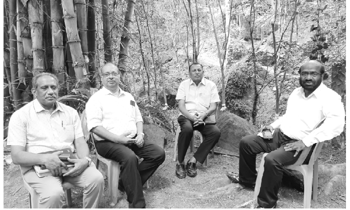
குறிப்பிட்ட இடமான அப்பன் G கேப் என்ற இடத்தில் மூங்கில் வனத்தில் அமர்ந்து இளைப்பாறினோம்.

முடிவில் மூங்கில் மரங்கள் நிறைந்த அடர்ந்த வனத்தில் ஒரு இடத்தில் வந்து சேர்ந்தோம். அந்த இடத்துக்கு பெயர் அப்பன் Gகேப் (APPAN-G-GAP) என்று அழைக்கப்படுகிறது. அங்கு சற்று இளைப்பாறிவிட்டு அருகில் மூங்கில்களாலும் மரத்தாலும் சதுரமான அகன்ற பரண் போன்ற இடத்தில் சென்று அமர்ந்தோம். பரண்