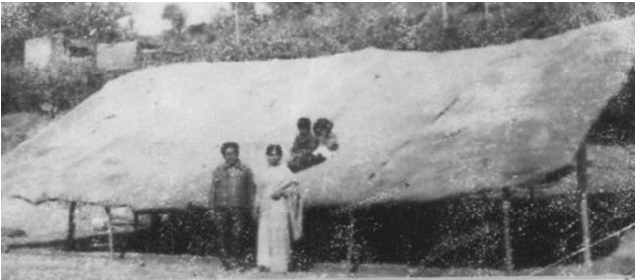
Temporary Worship Hall prepared by Army Friends

இஸ்லாமியரும், பண்டிட் (பிராமின்) மதத்தினரும் நிறைந்த