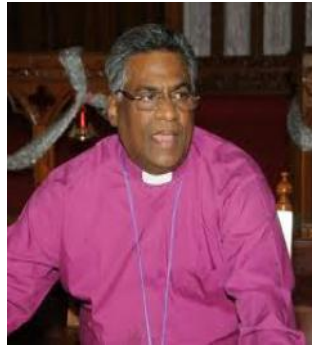
Most Rev.Dyvasirvadam, Dupty Moderator. Moderator