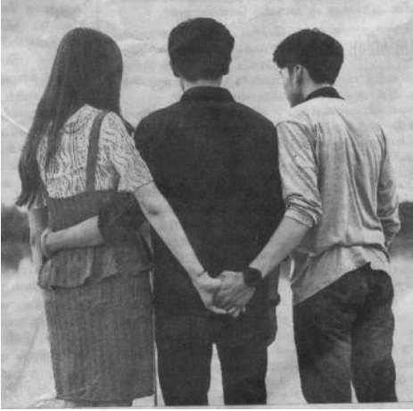
கள்ள உறவு குற்றமில்லை உச்ச நீதிமன்ற தீர்ப்பு

நான் எழுதுவது உச்சநீதிமன்றம் எழுதிய தீர்ப்பை எழுதிய நீதிபதியை கண்டித்து எழுதுவதல்ல. நீதிமன்றம் அறிவித்த தீர்ப்பு கிறிஸ்தவ வேத புத்தகத்தின் அறிவுரைக்கு எப்படி எதிரானது என்பதை என் வாசகர்களுக்கு அறிவிக்கிறேன். அது இந்தியனாகிய நான் பெற்ற எழுத்து உரிமை ஆகும். அந்த சுதந்திரத்தின் அடிப்படையில் இந்தியாவிலுள்ள அனைத்து மதத்தினருக்காகவும் இது எழுதப்பட்டதல்ல. இது கிறிஸ்தவர்களுக்காக குறிப்பாக என் ஜாமக்காரன் வாசகர்களுக்காக மட்டுமே எழுதப்படுவதற்கும். இது வெறும் ஒப்பீடு ஆகும்.