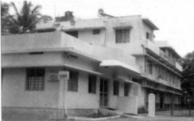
Bethany Medical Centre, Anaikatty Tribal Mission Hospital