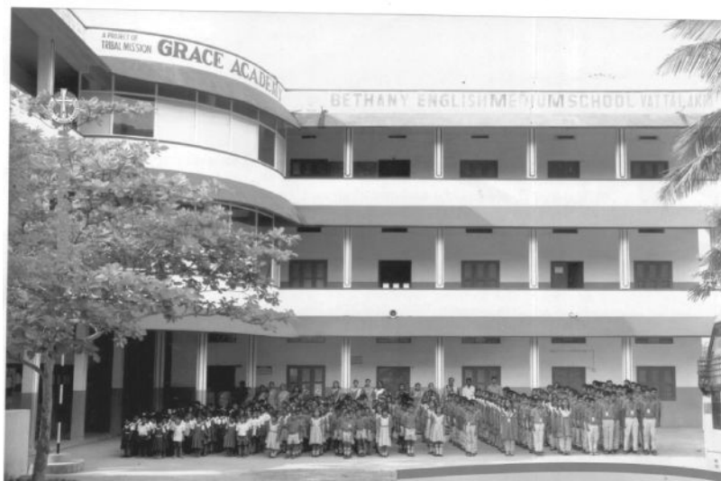
Bethany English Medium High School, (Tribal Mission School)