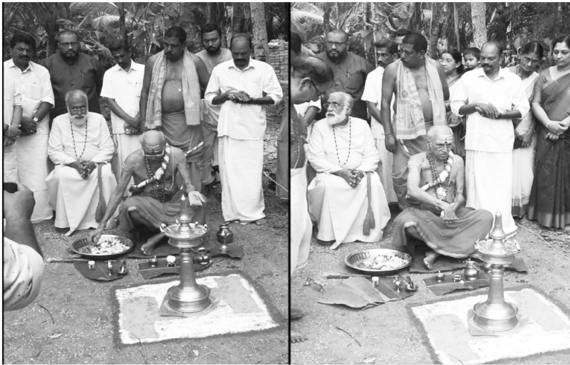
Former Church of South India Moderator and Madhya Kerala Bishop taking Part in Hindhu Pooja ritual STOP HIS PENSION IMMEDIATELY

ലക്ഷക്കണക്കിന് ജനങ്ങളെ ദൈവം തന്നെ കൊന്നതുപോലെ, മരിച്ചു ശവശരീരത്തെ ഇടാൻ പോലും കുഴികൾ വെട്ടാൻ ആളുകൾ കിട്ടാത്ത സ്ഥിതി പല സ്ഥലത്തിൽ ഉണ്ടായതായി അറിഞ്ഞു. ഇതു കാരണം ഹിന്ദു മുസ്ലീം ക്രിസ്ത്യാനി എല്ലാപേരെയും ഒറ്റക്കുഴിയിലാക്കി. ലോകം മുഴുവൻ ഉള്ള ജനങ്ങൾ ദൈവത്തിന്റെ മനസ്സു വേദനിപ്പിച്ച വേറെ ചില കാരണങ്ങളാലും ബാധിക്കപ്പെട്ടു. എന്നിട്ടും ജനങ്ങൾക്ക് ബുദ്ധി തെളിഞ്ഞിട്ടില്ല. ആ ചില മാസങ്ങൾ ഉണ്ടായ ദയവും ഭക്തിയും മാറിപ്പോയി. ഇതു ഇസ്രായേൽ ജനങ്ങളുടെ കാലം മുതൽ നടക്കുന്നതാണ്.